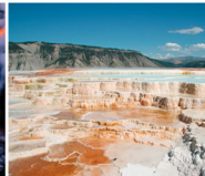
Yellowstone - U.S.A.