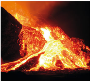
Etna - SICILY