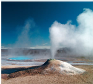
Geysir - ICELAND