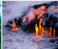
Kilauea - HAWAII