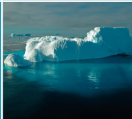
Iceberg - ANTARCTICA