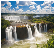
Iguassu - BRASIL