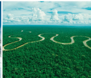
Amazon forest - BRASIL