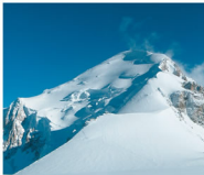
Mont Blanc - FRANCE