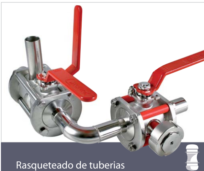
Rasqueteado de tuberías

■ Válvulas criogénicas para trabajar a -196°C. (Nitrógeno líquido, CO2, etc.)