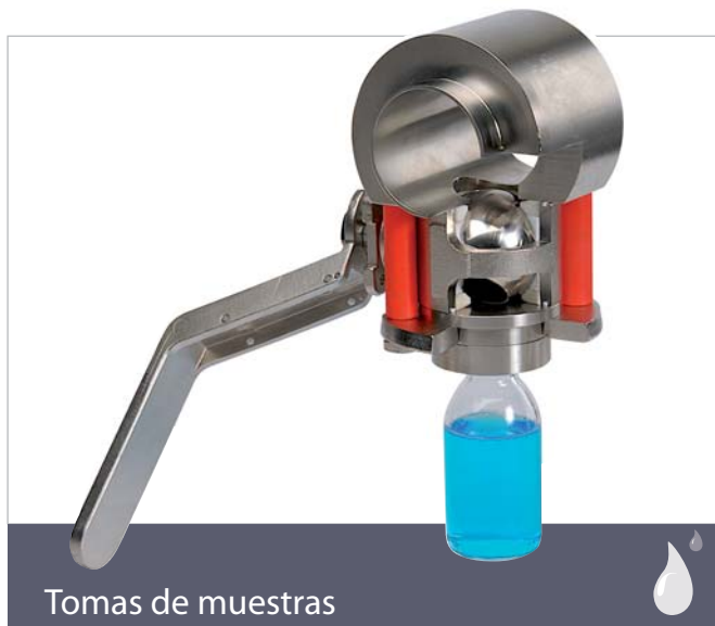
Tomas de muestras

■ Válvula de toma muestras bajo presión. (Acido sulfúrico, sosa caustica, pinturas, etc.)